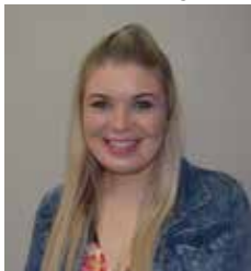
M. SNETLER Mediasentrum Bemarking