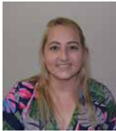
D. DU PIESANIE