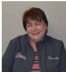
M. WAIT Sekretaesse